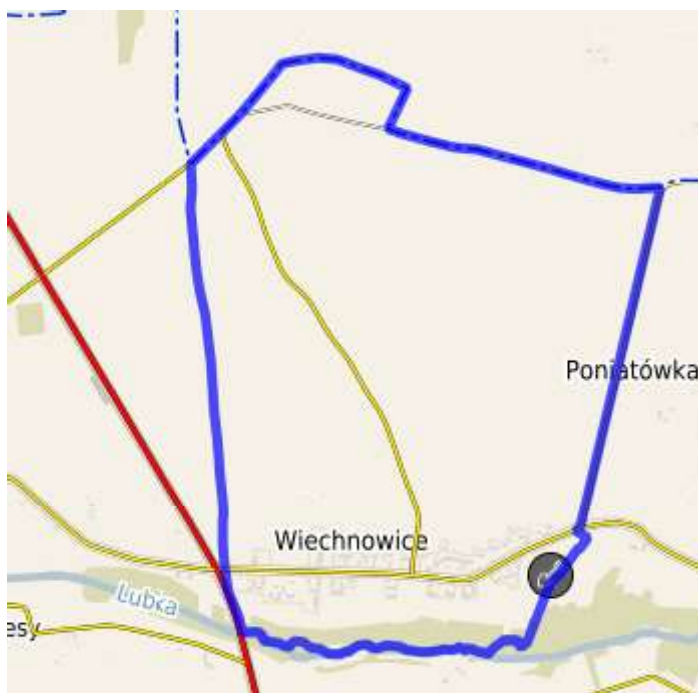
Rys. 1. Obręb miejscowości Wiechnowice

Z uwagi na swe położenie, czyste powietrze, pobliskie lasy, ciszę i spokój miejscowość świetnie spełnia warunki do zamieszkania z dala od zgiełku wielkich miast. Domy jednorodzinne wraz z budynkami gospodarczymi znajdują się w zwartej zabudowie osadniczej, jedynie pojedyncze gospodarstwa położone są w znacznej odległości od centrum wsi.